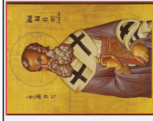
القديس حزقيال النبي